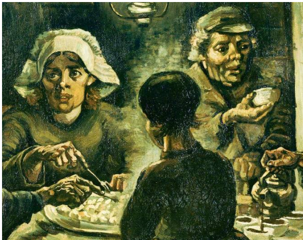
Vincent VAN GOGH, De aardappeleters – detail (1885)

In de arbeidersgezinnen die er gebruik van maakten, en er in zekere mate ook afhankelijk van waren wat hun levensonderhoud betreft, was kinderarbeid vrij gebruikelijk, meer nog, vaak levensnoodzakelijk. De wet op de leerplicht tot twaalf jaar dateert van 19 mei 1914. De ongeletterdheid was gigantisch. Met de kennis van de correcte termen in ‘mooi beschaafd Nederlands’ was het heel droevig gesteld. Het is ook maar de vraag of het toen allemaal wel zoveel uitmaakte. Een arbeidersgezin zal dan alvast niet wakker hebben gelegen van een al dan niet correcte term... wat van de zorgen over het gezinsbudget niet kon worden gezegd.